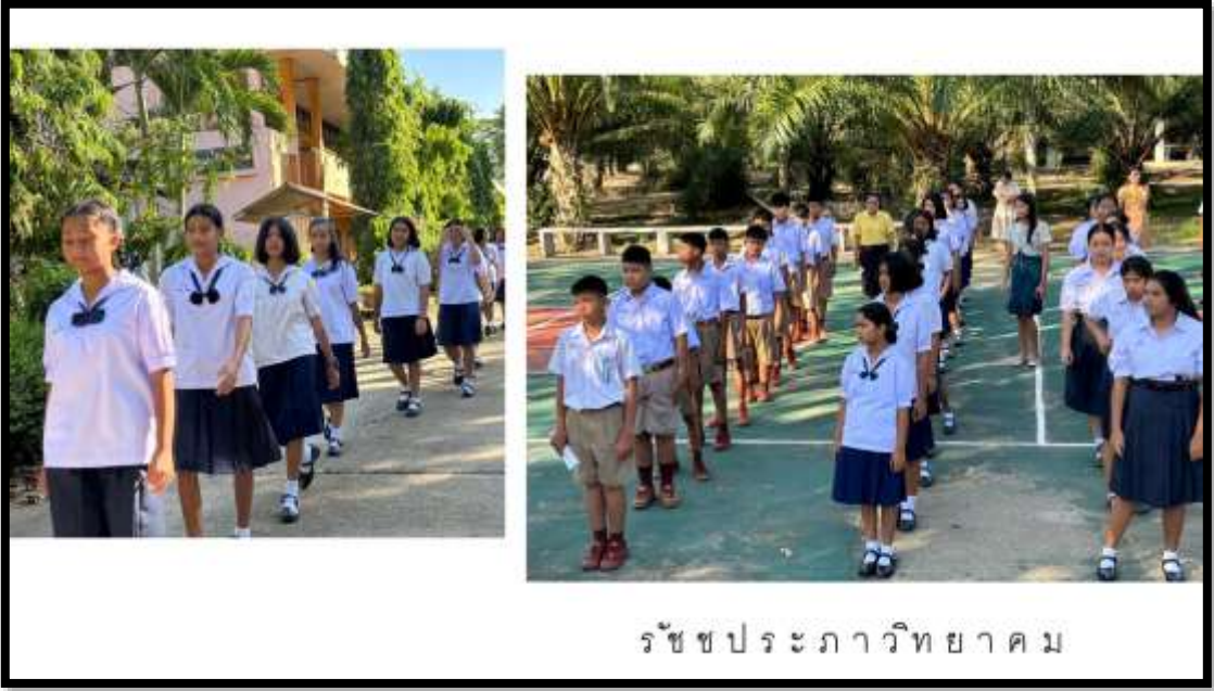
กิจกรรมหน้าเสาธง

กิจกรรมเนื่องในโอกาสวันเฉลิมพระชนมพรรษาสมเด็จพระนางเจ้าสุทิดา พัชรสุธาพิมลลักษณ พระบรมราชินี