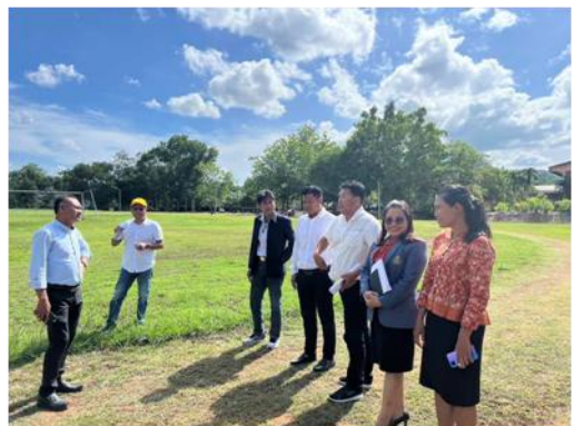
ภาพการประชุมคณะกรรมการสถานศึกษาขั้นพื้นฐานโรงเรียนรัชชประภาวิทยาคม