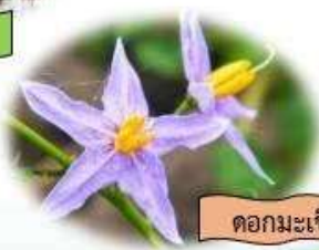
ดอกมะเขือ