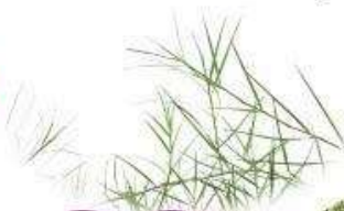
หญ้าแพรก